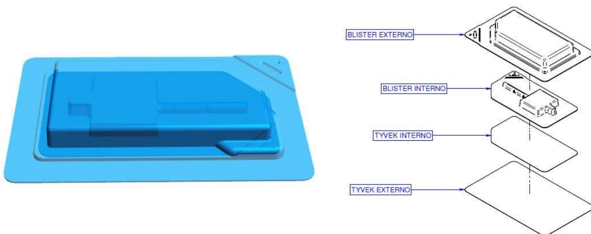
Figura 3 – Representação do blister selado e sua ordem de montagem

O produto médico é colocado no blister primário e selado. Em seguida, o blister primário é colocado no blister secundário e selado, conforme sequência indicado na figura 3. Os blisters contendo o implante é colocado dentro da caixa individual: