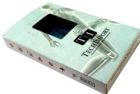
Figura 4– Representação da embalagem contendo o implante e os

O produto médico é colocado no blister primário e selado. Em seguida, o blister primário é colocado no blister secundário e selado, conforme sequência indicado na figura 3. Os blisters contendo o implante é colocado dentro da caixa individual: