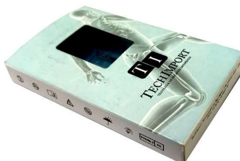
Figura 4– Representação da embalagem contendo o implante e os rótulos (imagem meramente ilustrativa)

O produto médico é colocado no blister primário e selado. Em seguida, o blister primário é colocado no blister secundário e selado, conforme sequência indicado na figura 3. Os blisters contendo o implante é colocado dentro da caixa individual: