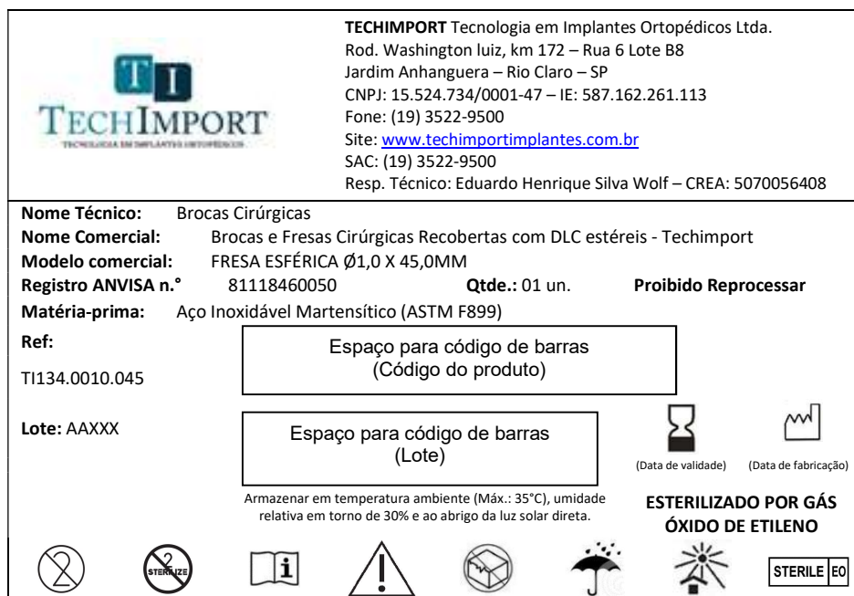
Figura 5 – Modelo de rotulo (etiqueta de rastreabilidade)

As BROCAS E FRESAS CIRÚRGICAS RECOBERTAS COM DLC ESTÉREIS - TECHIMPORT são rotulados com o rotulo mostrado na figura 5.