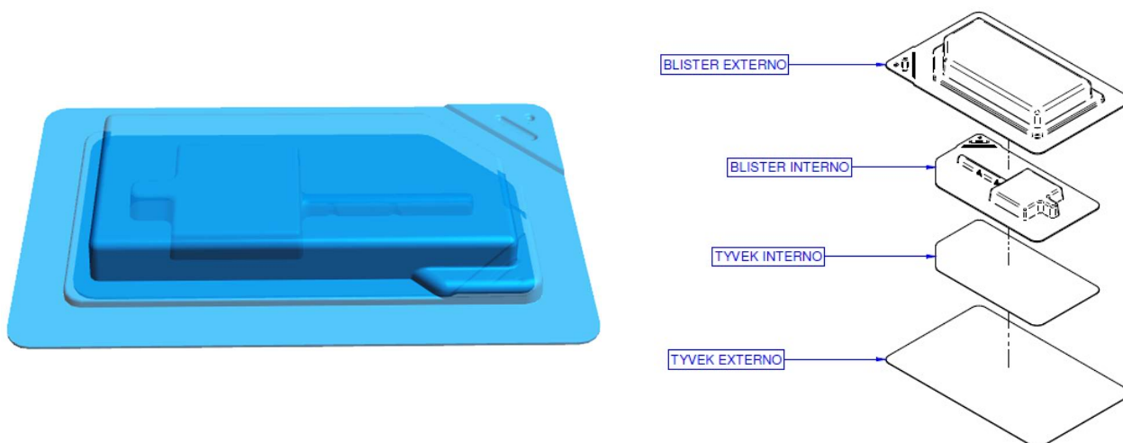
Figura 3 – Representação do blister selado e sua ordem de montagem

O produto médico é colocado no blister primário e selado. Em seguida, o blister primário é colocado no blister secundário e selado, conforme sequência indicado na figura 3. Os blisters contendo o implante é colocado dentro da caixa individual: