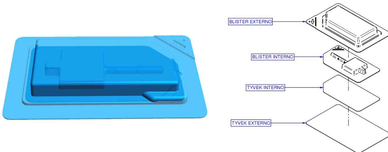
Figura 3 – Representação do blister selado e sua ordem de montagem

O produto médico é colocado no blister primário e selado. Em seguida, o blister primário é colocado no blister secundário e selado, conforme sequência indicado na figura 3. Os blisters contendo o implante é colocado dentro da caixa individual: