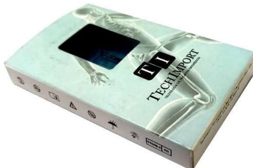
Figura 4– Representação da embalagem contendo o implante e os rótulos (imagem meramente ilustrativa)

O produto médico é colocado no blister primário e selado. Em seguida, o blister primário é colocado no blister secundário e selado, conforme sequência indicado na figura 3. Os blisters contendo o implante é colocado dentro da caixa individual: