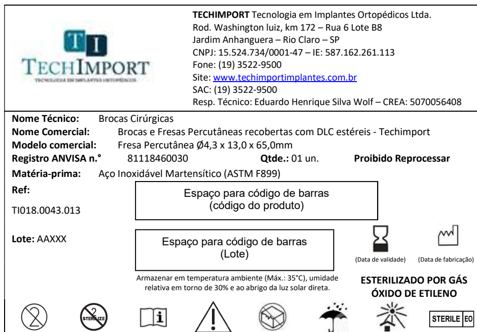
Figura 5 – Modelo de rotulo (etiqueta de rastreabilidade)

De acordo com a RDC 59/2008, para os materiais de uso em saúde implantáveis de uso permanente de alto e máximo risco, o fabricante ou importador deve disponibilizar etiquetas de rastreabilidade com a identificação de cada material ou componentes de sistema implantável.