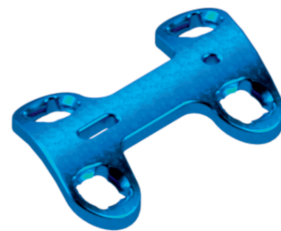
Placa Bloqueada AV Universal Sistema 2,7 para Pé

TI003.3000.00X - espaçador de 0 mm a 8,0 mm