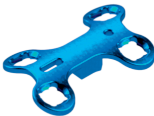
Placa Bloqueada AV tipo Cunha Sistema 2,7

TI003.2000.035 - 06 Furos 35,0 mm TI003.2000.040 - 06 Furos 40,0 mm