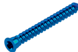
Parafuso não Bloqueado TX8 Ø2,7 mm

TI001.0027.0XX - comprimento de 8,0 mm a 30,0 mm Fabricados em Liga de Titânio ASTM F136