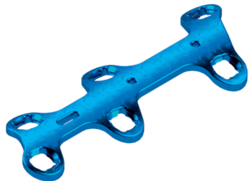
Placa Bloqueada AV de Reconstrução 06 Furos

Reconstruction plate / Placa de reconstrucción