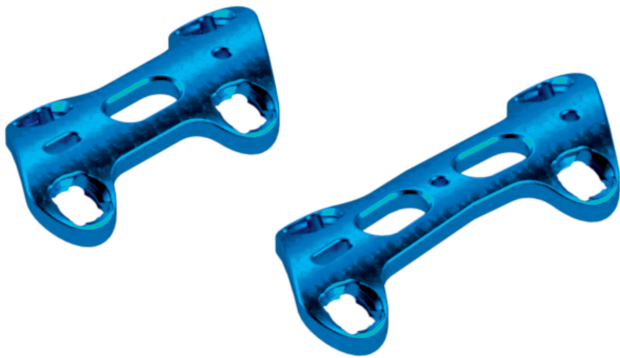
Placa Bloqueada AV para Fixação/Fusão do 1º Metatarso/Falange