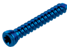
Parafuso Bloqueado TX8 Ø2,7 mm

TI003.4000.0XX - comprimento de 10,0 mm a 30,0 mm